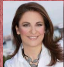
Βαρβάρα Αυδή Ελληνικά Ιστορικά Ξενοδοχεία