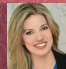
Τίνα Τορίμπαπατα Hilton Athens