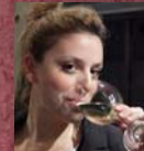
Μαρία Μαλτέζου Κατώγι και Στροφιλιά Α.Ε.