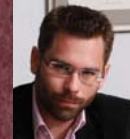
Λεωνίδας Μπέης Kassandra Bay Resort & Spa